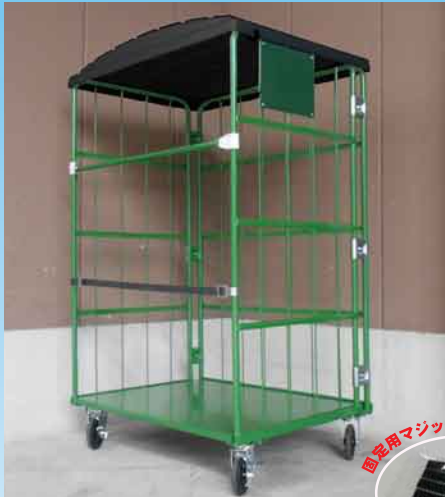
リレーカーゴ装着時