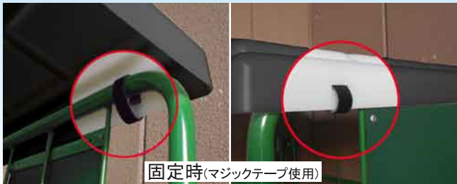
固定時(マジックテープ使用)